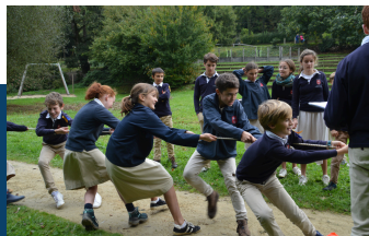
le tir à la corde, une des joies des olympiades !