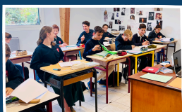
La promotion de 3ème en pleine action !