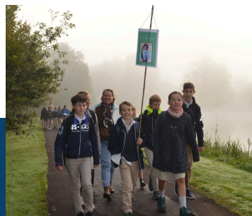
En marche vers Josselin !